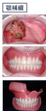
顎義歯と舌接触補助床例