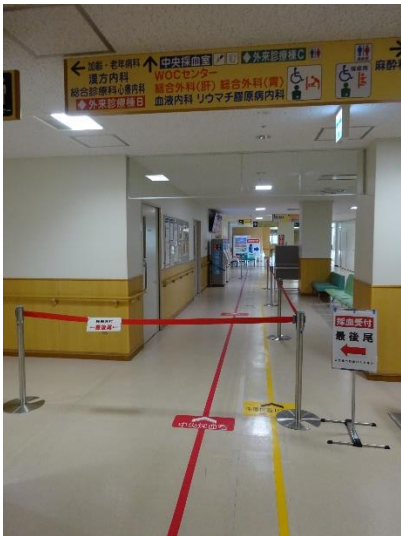
受付機は三台設置

①エレベーターを降り左手に、受付機まで以下の様な案内がありますので、案内ゲート内に順番にお並びください。