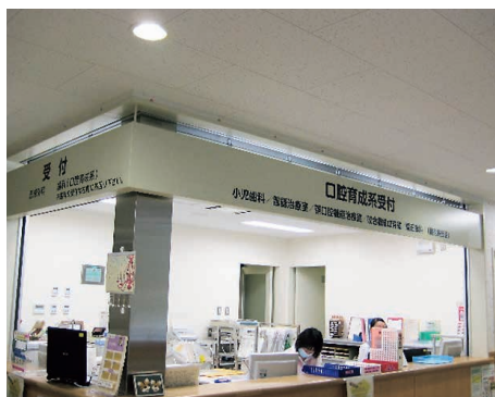
小児に関連した診療科が配置された新外来診療棟3階。小児科等の医科診療科も隣接しており、相互に連携した小児医療が行われている。3部屋ある。

一般的な歯科治療のみならず、小児期の歯並びの治療、小児の口腔外科処置、障害児への対応など、小児期にかかわる歯科はすべて当科で対応しております。