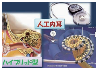
残存する聴力を温存する、人工内耳治療