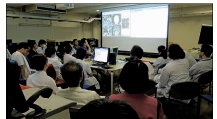
頭頸部腫瘍センターの様子