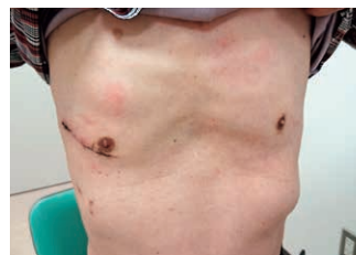
MICS-MVP(低侵襲僧帽弁手術)の術後3週での創部(ご本人からの承諾を得て掲載)