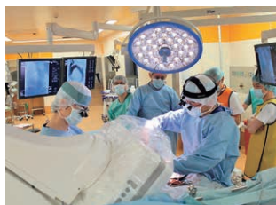
ハイブリッド手術室でのステントグラフト内挿術

さらに当施設では日本心臓血管外科データベース(NCD / JCVSD)に2001年の設立当初から参加し、我が国における疾患重症度に応じた手術成績の算定およびリスク予測に積極的に貢献しております。