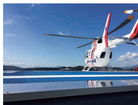
ドクターヘリは屋上ヘリポートから現場に向かい、近隣県との協力も図ります。