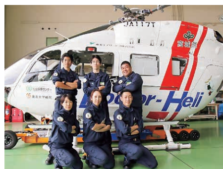
2016年秋から運用を開始したドクターヘリです。県内全域の救急患者さんに現場から救急医療を提供します。