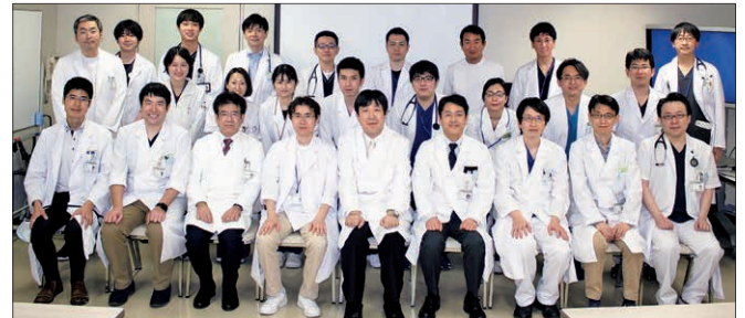
スタッフ集合写真