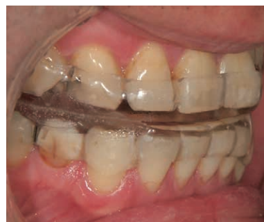
図2 睡眠時無呼吸症候群におけるオーラルアプライアンスを用いた治療