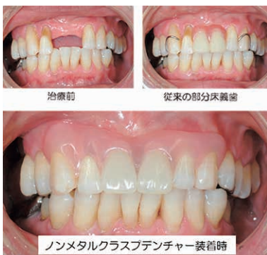
図1 ノンメタルクラスプデンチャーを用いた治療