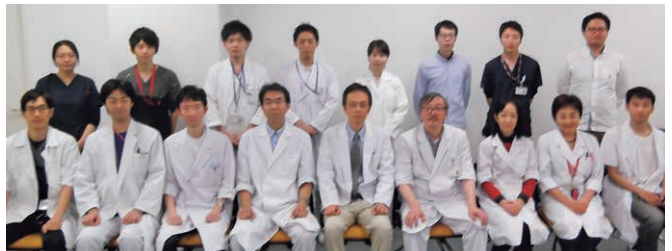
歯周病科のスタッフ