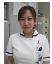
文責：布田美貴子 (管理栄養士)