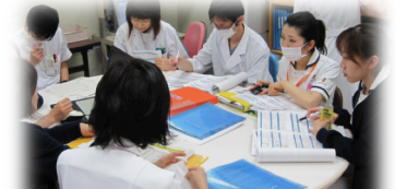
西8階NSTカンファレンスの様子

栄養サポート加算算定件数 2010年度:9件、2011年度:455件、2012年度:502件、2013年度:208件(2013年6月末現在)