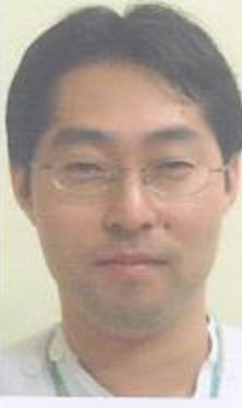
(文責; 肢体リハ 瀬田 拓)

①癌を切除する手術、②膝の痛みに対する関節手術、③糖尿病に対するインスリン注射。それぞれの治療目的は何か?様々な考え方に基づいて治療は行われますが、どんな治療でも最終目的(目標)はQOL(Quality of Life)向上にあります。それでは誰のQOL向上を目標にするのか?目の前にいる患者だけのQOLですか?医療サービスは、対個人に提供されるものですが、常に社会的側面も併せ持つことから、患者個人を取り巻く家族、さらに地域の生活向上、不安の解消による間接的なQOL向上も大いに期待できると思います。また医療者自身はどうでしょう?医療サービスは医療者の「自己犠牲」の上に成り立つという概念が横行していることも事実ではありますが、患者や地域のQOL向上が医療者自身の喜びとなるならば、それはまた医療者自身のQOL向上にも繋がることとなります。 さて摂食機能療法は患者のQOLを向上させるか?少なくとも統計処理をすれば、必ずYESという答えになると私は信じています。しかし統計処理には、個々の問題を隠してしまう欠点があります。中には、摂食機能療法そのものがQOLを低下させてしまうような例も出てくるでしょう。そして摂食を拒否する患者もでてくるでしょう。そんな時、是非考えてください。患者は何を拒否しているのか?「食べる楽しみ」の拒否ですか?摂食機能療法という方法に対する拒否、医療者の態度や存在に対する拒否、または障害を抱えた患者自身に対する拒絶もあるでしょう。「食べる楽しみ」を拒絶する患者はいない。これも私の信じるところです。