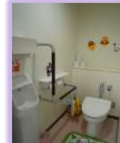
室内にある子ども用トイレです