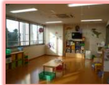
星の子ルームのお部屋です

星の子ルームは東北大学病院の外来棟 5 階に設置されており、東北大学の教職員、学生のお子様(生後 6 ヶ月から小学 3 年生)が対象となっています。病気の回復期で登園、登校ができない時に安心して預けることができる環境づくりを心掛け、看護・保育をしております。初めての利用を考えている方に写真で簡単にご紹介します。