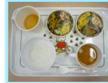
幼児食の一例です