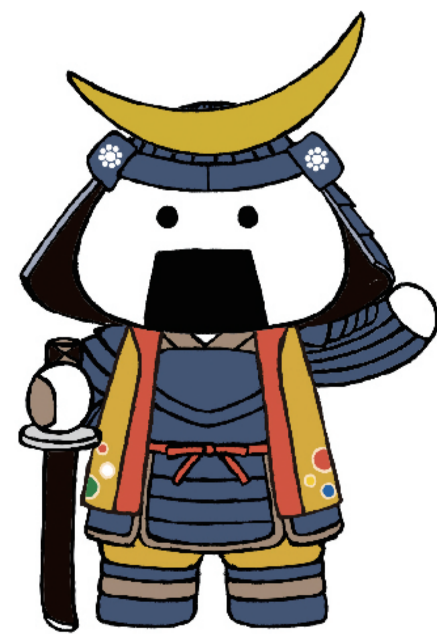
仙台・宮城観光PRキャラクター むすび丸