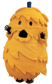
栗原市マスコットキャラクター ねじりほんによ