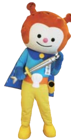
気仙沼市観光キャラクター 海の子ホヤぼーや