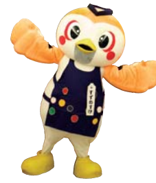
仙台・青葉まつりマスコットキャラクター 青葉すずのすけ